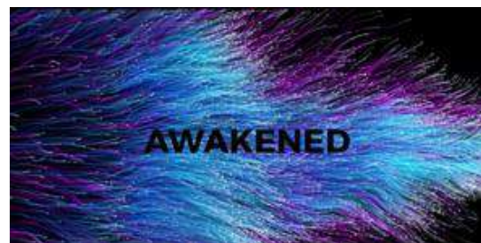
Marcel: The Vision 公開用イメージ映像（英語） https://youtu.be/duI6FmLD8yA